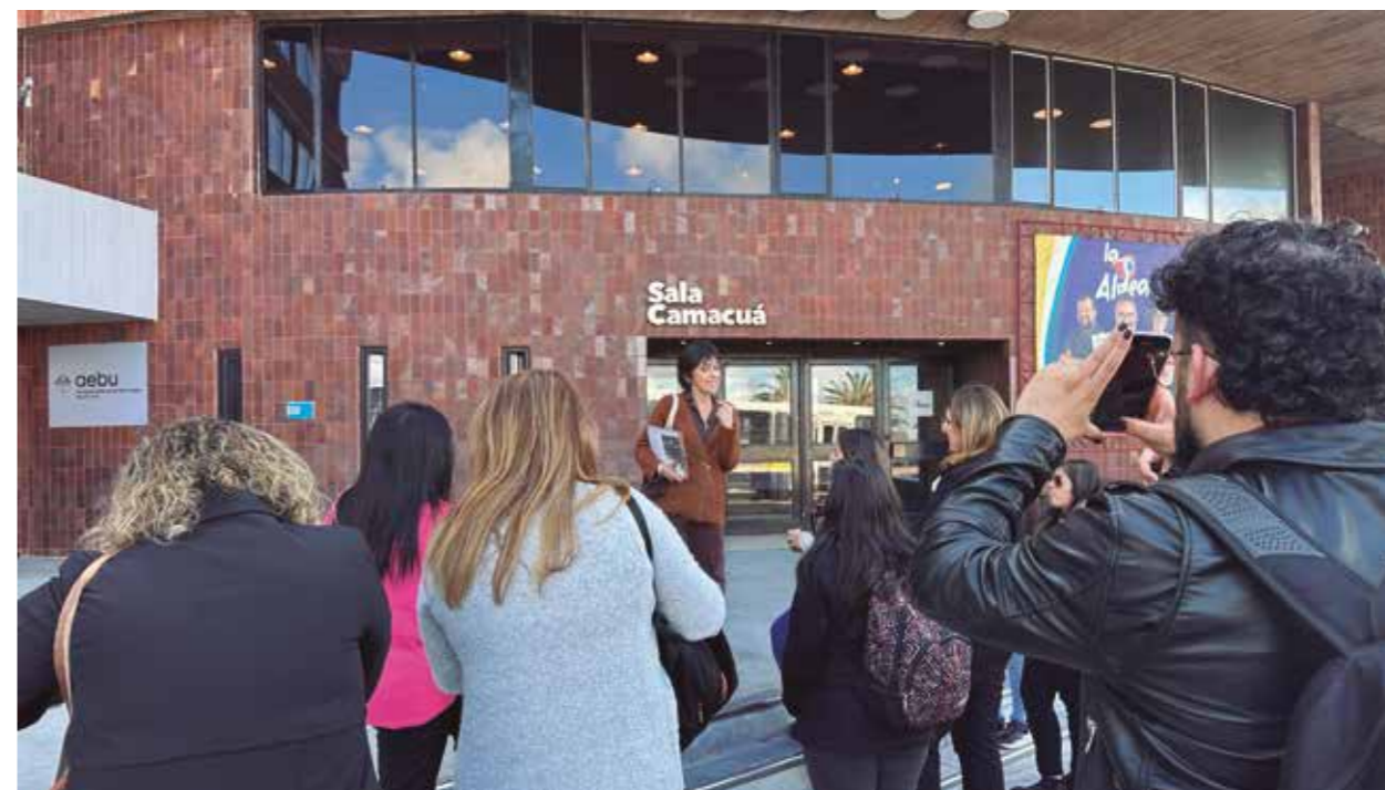
Recorrido histórico por el edificio de AEBU

Militantes y funcionarios de AEBU del interior participaron en nuestra sede central de actividades múltiples que cerraron un trabajo conjunto desarrollado a lo largo del mes de setiembre.